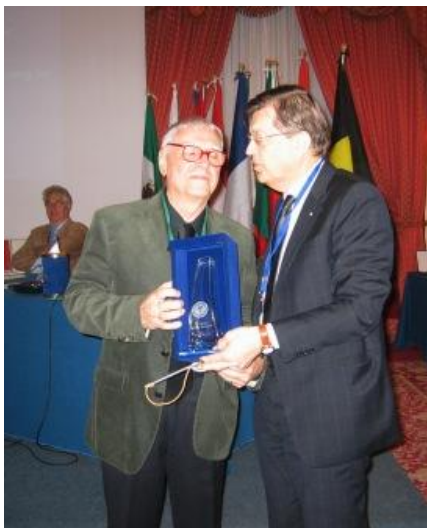
Da Costa - Prandi