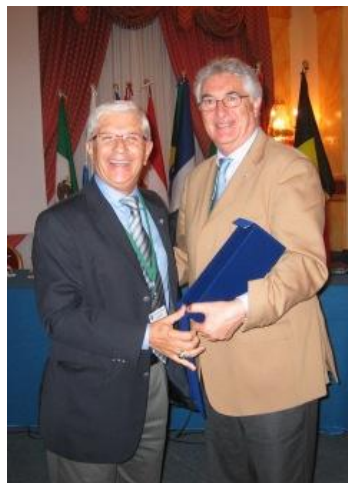
Bramante - Monego