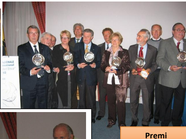
Premi comunicazione 2009