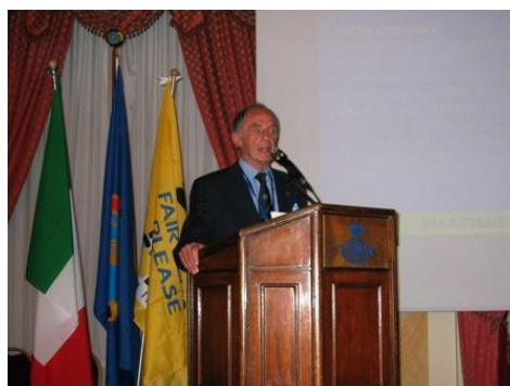
Presidente Club Mottarone